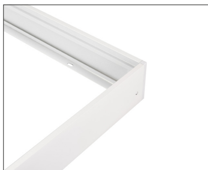
032970 Набор SX6060T White

Белая рамка для накладной установки панелей