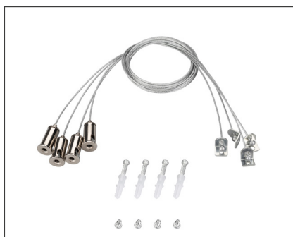
029583(1) Набор SPX-T4 для панелей 600x600

Белая рамка для накладной установки панелей